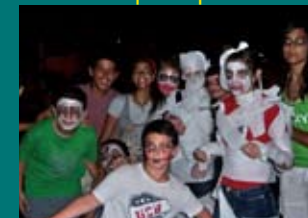
La noche del terror