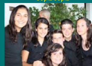
Despedida de gala