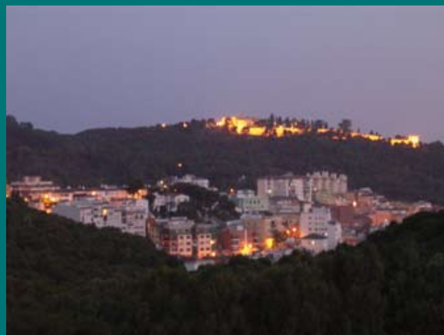
Sede del curso. Seminario de Málaga