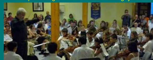
El maestro se motiva